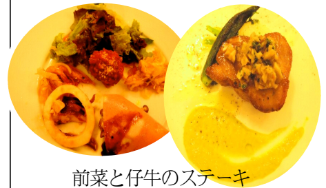
前菜と仔牛のステーキ