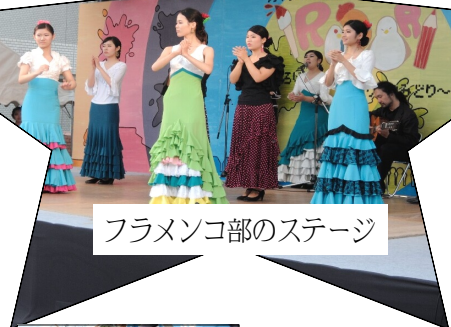
フラメンコ部のステージ